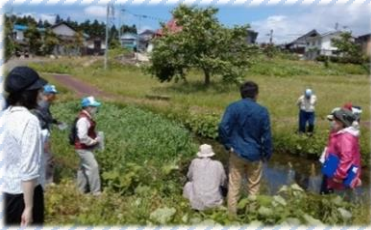
中川原の湧水とイバラトミヨ