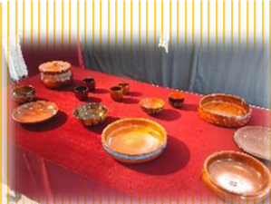
市竹工房 漆工芸展 4/5～5/28 開催