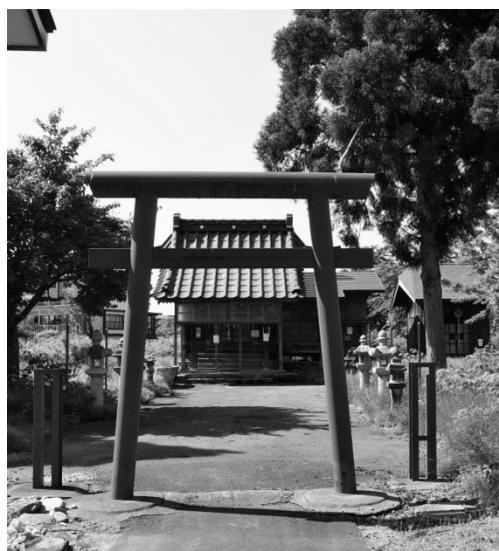
第1番 神宮寺 薬師如来

山形には「最上三十三観音」のほか、「庄内三十三観音」、「置賜三十三観音」があり、この3コースを合わせ「出羽百観音」と呼ばれています。「最上三十三観音順礼始」によりますと、最上札所の起こりは室町時代に遡り、今年で開創 577 年になるといわれております。