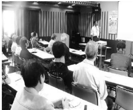
たくさんの方々に参加いただきました