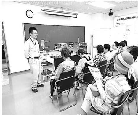
浄水場の職員の話に耳を傾ける

今回のセミナーのテーマは『水資源と街並散策』。豊富な水資源に感謝すると共に、自然と調和した街づくりの大切さにも改めて考えさせられました。