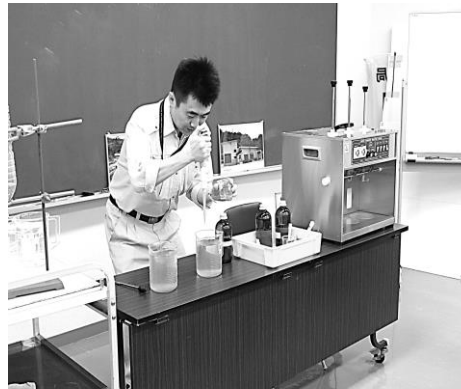
『濁り水のろ過』実験の様子