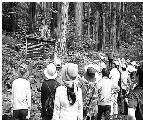
大杉の迫力に息をのむ参加者たち