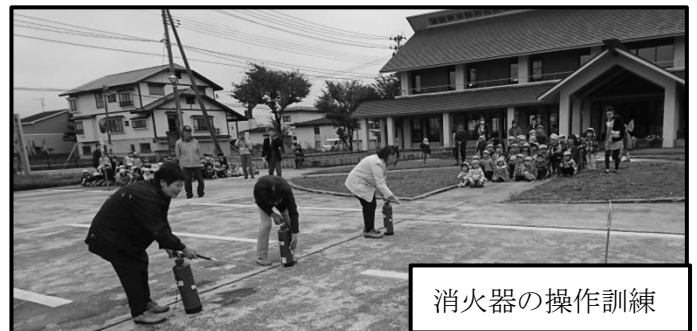
消火器の操作訓練

10月25日、強い地震に伴う火災の発生を想定した、避難訓練を行いました。 消防署本部からポンプ車を派遣していただき、放水演習や消火器操作訓練を含めた訓練を行いました。 沼田小学校、近隣の保育園、近隣町内会、合わせて208名の方に参加していただきました。 今年は、地震を体験できる車(起震車)を県庁からお借りし地震を、模擬体験しました。災害を身近に感じることで、改めて地震の怖さや避難訓練の大切さを実感しました。