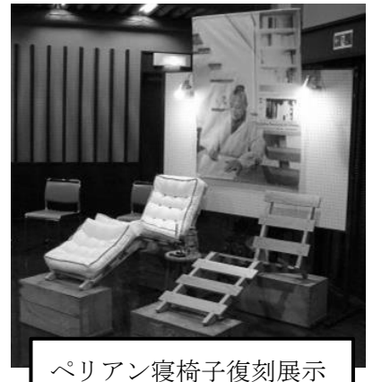
ペリアン寝椅子復刻展示