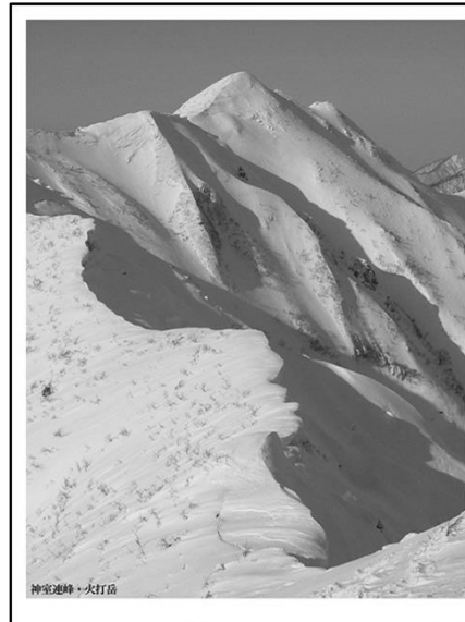
神室連峰と山形千山文化展 山形千山越えの基礎資料展示