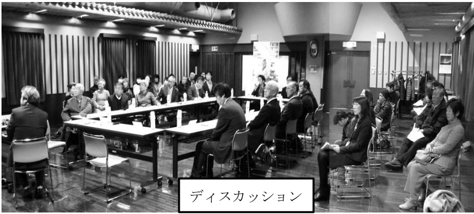
ディスカッション