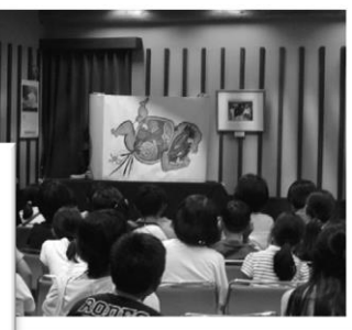
午後からは、紙芝居鑑賞とアイス作り♪楽しかった合図はグーで!!