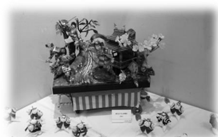
*新庄まつり山車の模型*