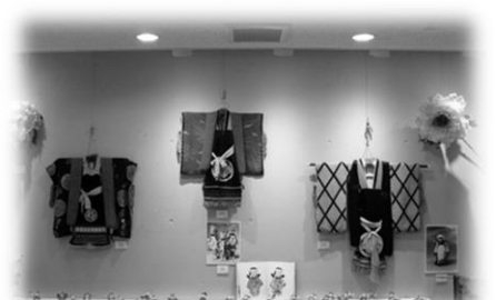
*大正時代の稚児衣装*