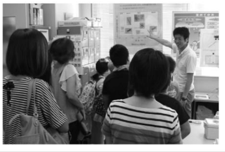
防災センターで雪の勉強と、真夏の降雪体験!! 寒ーい!!

真夏に雪を体験し、雪に関する知識を高め、楽しい夏休みの思い出の一つにして頂けたのではないかと思います。