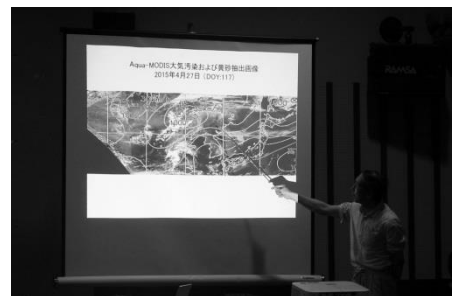
衛星画像を用いて大気の流れの詳しい解説