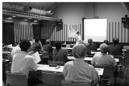
画像を使った分かりやすい解説