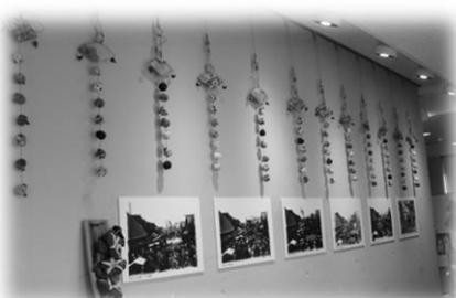
*つるし飾りと明治の新庄まつり写真*