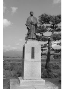
高橋猪一氏銅像（昭和）